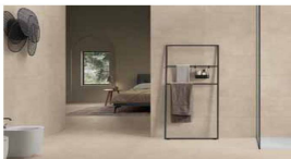
Pavimento e rivestimento bagni gres porcellanato 40x80