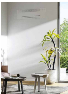
Climatizzazione estiva Split Innova Filomuro