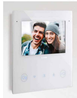
Videocitofono WiFi Vimar