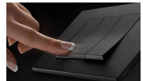
Impianto elettrico Vimar Linea