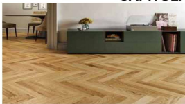
Pavimento in parquet a tolda di nave o diagonale a correre