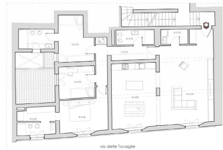
via delle Tovaglie