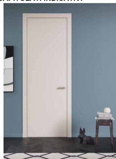
Porte interne in legno laccato lucido/opaco