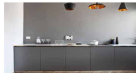
Rivestimento parete cucina con tinta a smalto